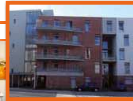
Résidence City Etudes